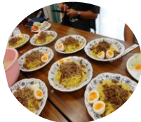
とうにゅうり 豆乳冷やしゴマ坦々麺