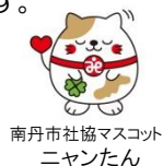
南丹市社協マスコット ニャンたん

※地域包括支援センターは 介護保険法に基づいて市町村が設置しています。 南丹市では委託を受けて、 南丹市社会福祉協議会が運営しています。