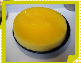
↑夏色★ ハワイアケーキ