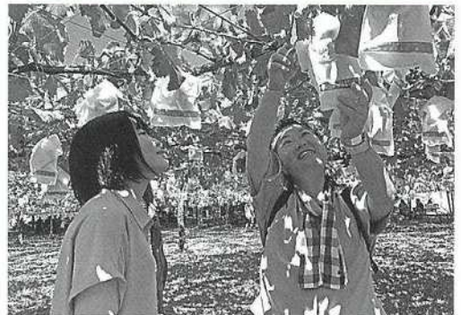
「母子寡婦父子交流事業」