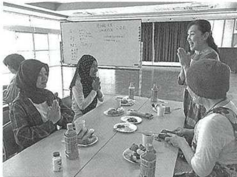
「外国籍住民交流会」

ご協力いただいた募金は木曾岬町の一人暮らし高齢者交流会・安否確認事業、母子寡婦父子交流事業、地域支え合い事業など地域福祉事業に活用されます。