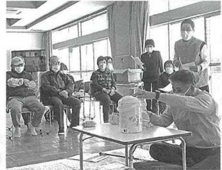
地域交流事業（12月）の様子

社会福祉協議会は、町内にお住まいの誰もが安心して住み慣れた地域で心豊かに暮らせるまちづくりを目指して地域福祉活動の推進に努めております。その事業財源は、町補助金などのほか、会員（町民）の皆様からの貴重な会費・寄付金収入等により賅われています。地域の福祉向上のためにも社会会費の納入にご協力をいただきますようお願いいたします。