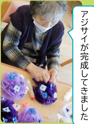
アジサイが完成してきました