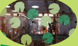
おたまじゃくしから蛙に成長！！