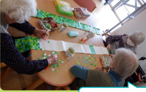
これは何になるでしょう？