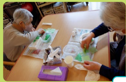
誕生日ケーキのいちごを作っています