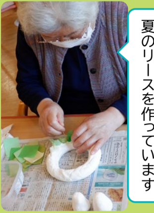
夏のリースを作っています