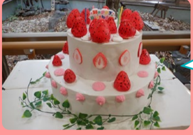
ケーキが新しくなりました！