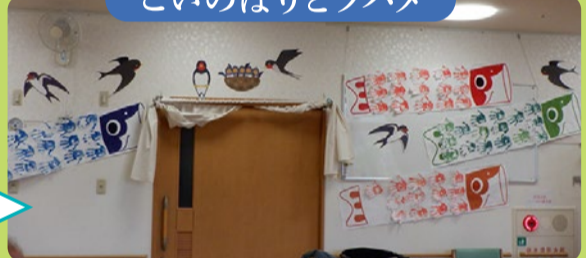
こいのぼりとツバメ