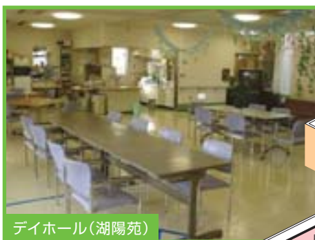
デイホール(湖陽苑)