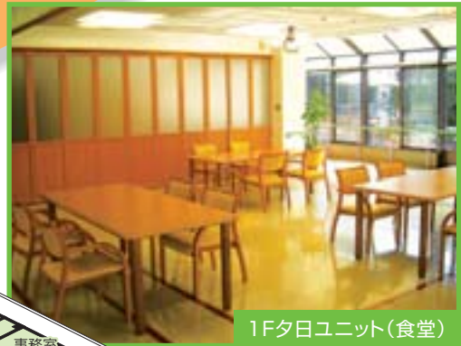
1F夕日ユニット(食堂)