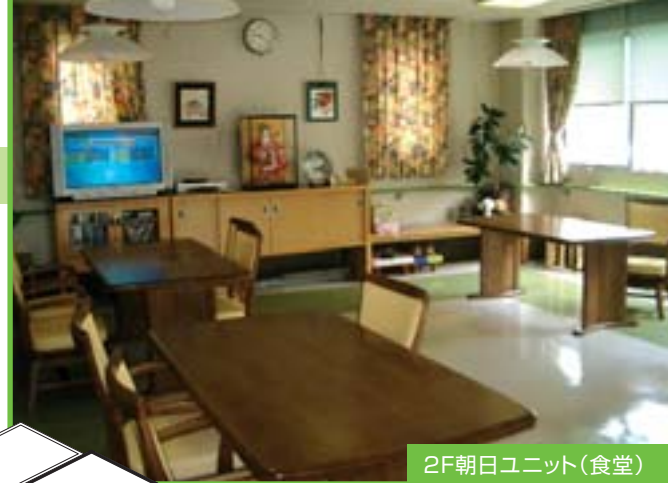
2F朝日ユニット(食堂)