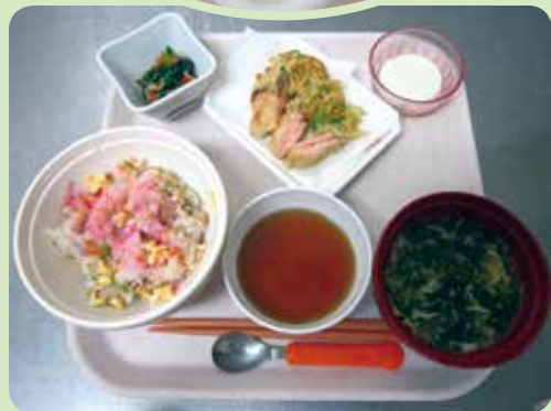
小松菜なめたけ和え