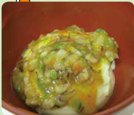
茶碗蒸しの五目あんかけ

【栄養士より一言】 口当たり滑らかな茶碗蒸しに五目あんをかけると、旨みと見た目の変化が加わり、食欲アップにつながります。海老や椎茸は、みじん切りにしてトロミをつけたあんにすることで「噛む」「飲み込む」がスムーズになり、さらに楽しんで食事をとることができるでしょう。