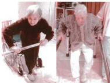
▲以前より足取りが軽くなりました

サービスホール隣の訓練スペースで、平行棒・立ち上がり・ゲーム機のWiiなどをつかって行っています。その他、余暇の時間には卓球をやる方や、昔を思い出し花札に興じる方など様々ですが、個別機能訓練などは皆さんやる気満々で関わっている看護師・スタッフよりも元気があります。これからも、デイサービスで過ごす時間が、ご自宅に戻れるからの生活にも、よりよいものになればと思っています。(波多野耕介記)