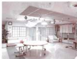
▲落ち着きのあるショートステイフロア

さつと簡単ではありますが、これがショートステイの大体の一日になります。利用されている皆さんにショ-