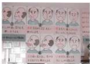
▲職員お手製の「口の運動」ポスター

はさぎの里デイサービスでは、昼食前に口腔体操を行っています。軽い体操で身体をほぐした後、発声訓練や口の運動(唇を突き出しひょっとこのような顔になったり唇を左右に向けたりなど)、そして魔法の言葉(パ・ダ・カ・ラの発音)で歌を唄います。唾液の分泌を促し誤嚥防止に努め、飲み込みをよくして、安全に美味しく食事をしていただきますと思っています。