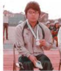
▲やったー!! 金メダル