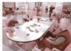
▲きれいに作るわよ

さて、今年の干支は辰ということで、昨年末に辰の貼り絵作りをしました。紙を切る方、紙を貼る方と集中して行いました。「ここでいろいろつか？」や「何が出来るんだ？」等言いながら楽しく手作業を行いました。完成作品がデイサービスに飾ってありますので、是非見に来て下さい。