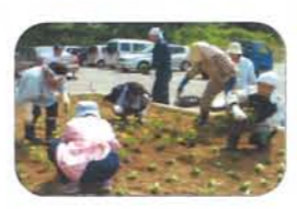
植栽ボランティア