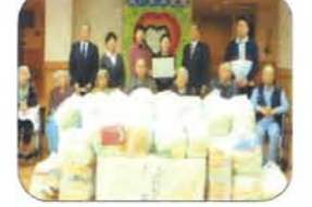
女性部会様より贈呈式