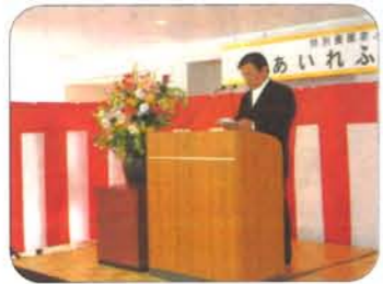
あいれふ安塚 竣工式