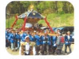
安塚春祭神輿渡御