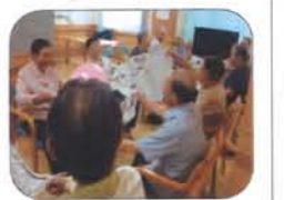
ボール送りゲーム

平成25年4月より毎月第1週・第3週の水・木曜日には『おたつしやくらぶ』を開催し、入居者様への参加を促し、身体機能の維持・向上に努めています。