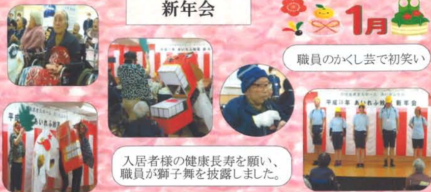
入居者の健康長寿を願い、職員が獅子舞を披露しました。