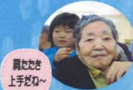
肩たたき上手だね～