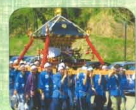
安塚の地に100年以上受け継がれている春祭。男性職員も担ぎ手として参加！