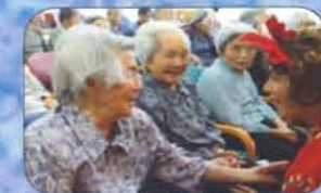
安塚保育園園児様との交流会。職員による寸劇は、園児様にも大好評！