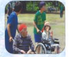
「紅白 玉入れ」高校生も一生懸命応援してくれました。