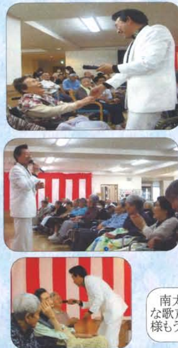
南太郎様の素敵な歌声に、入居者様もうっとり…