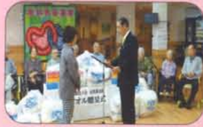
高田法人会 女性部様より タオルの寄付を頂きました。