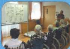
アコーディオンの優しい音色