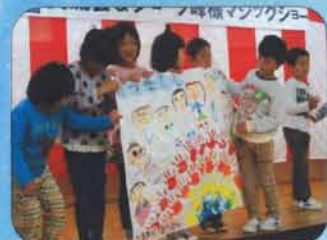
園児さんからプレゼント