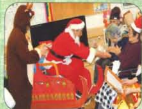
エリザベス様のクリスマス