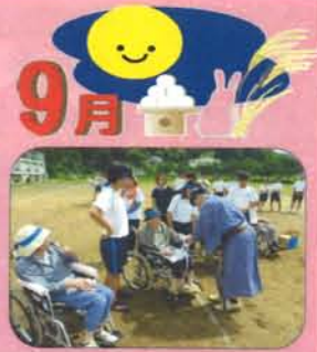
「運んで、送って深まる絆」(物送りゲーム)