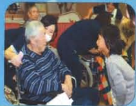
安塚放課後 児童クラブ様との交流会