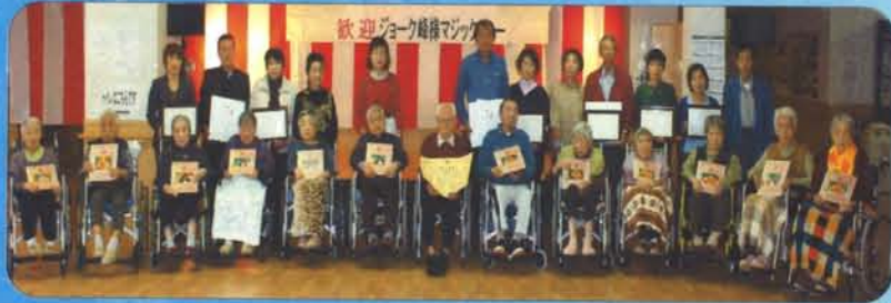
ジョーク峰様をお招きし「マジックショー」を開催。祝い年を迎えられる15名の方のお祝いを行いました。