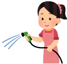
庭の掃除 花木への水やり