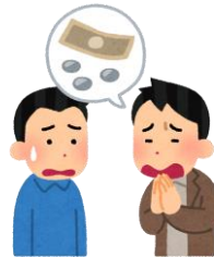
金銭の貸し借り ヘルパーへの贈 り物やお礼