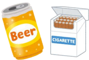
生活必需品 以外の買い物