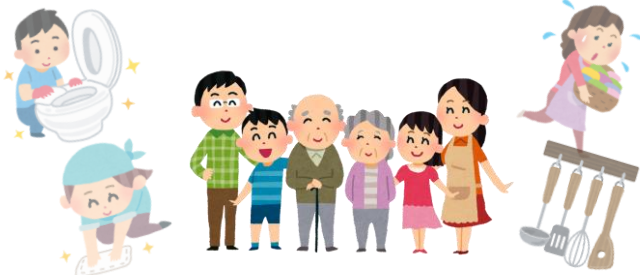
家族も使う (共有部分)の掃除