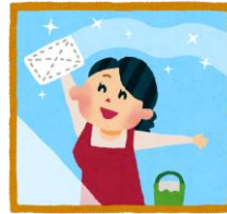
過度な掃除 (窓ガラス磨き) (床のワックスかけ)