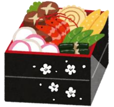
特別に手間を かけた調理