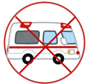
救急搬送時の同行