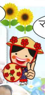
マイク借りて 来たよ