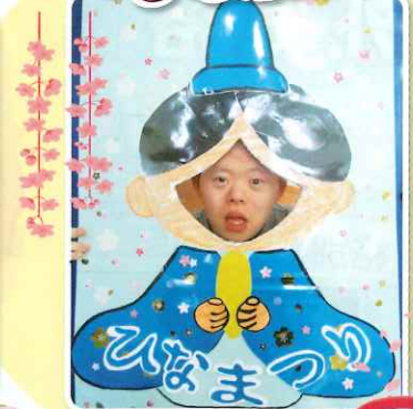
おだいりさまに変身!