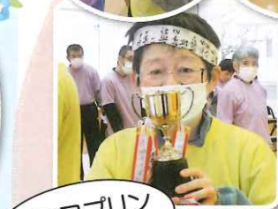
チョコプリン 最高