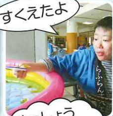
やっしょう まかしよ