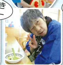
たこ焼き うまいー