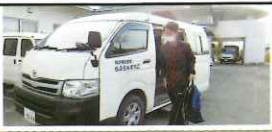
元気な挨拶でスタート!