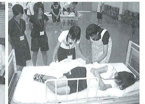
高校生介護等体験事業