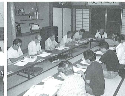
福祉協力員の懇談会