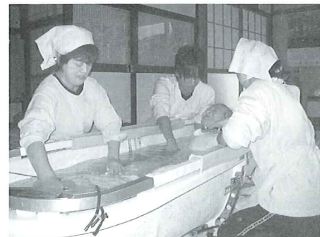
訪問入浴サービス