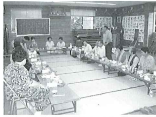
ふれあいいきいきサロン