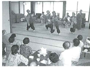
お元気温泉デイサービス