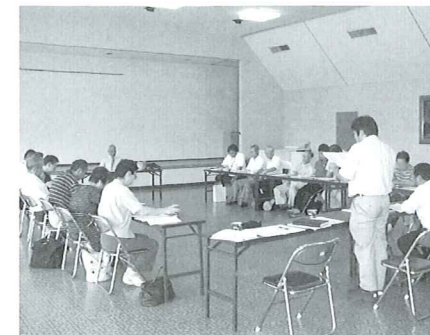
地域福祉推進会議

○社会福祉協議会の運営(理事会・評議員会) ○役員・職員の専門性の確立・向上 ○事務局体制の整備と適切な職員配置 ○社会福祉協議会活動業務の合理化・効率化 ○新規介護保険事業の検討 ◎職員の待遇・資質の向上 ○社会福祉協議会事業の点検、調査活動(地域福祉推進会議) ◎上山市地域福祉活動計画の評価と見直し