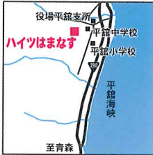
ハイツはまなす 外ヶ浜町平館根岸湯の沢 海の見える丘団地69-8