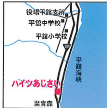
ハイツあじさい 外ヶ浜町平館野田山下382-1