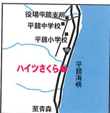
ハイツさくら 外ヶ浜町平館野田鳴川125