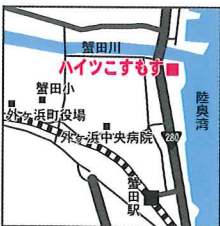
ハイツこすもす 外ヶ浜町蟹田183-2