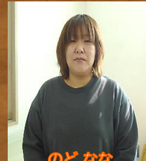
のどな なな 野土 菜々