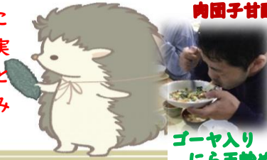
ゴーヤ入り肉団子甘酢煮

※農福連携とは、生産者が農業分野で活躍することを通じ、自身や生きがいを持って社会参加を実現していく取組です。農福連携に取り組むことで、障害者等の就労や生きがいづくりの場をうみだすことができます。